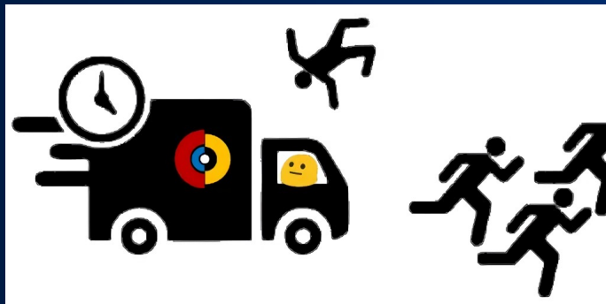
↖ AOSC 的创，是泥头车的创